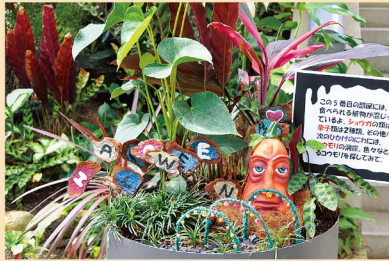
きもカワイイ! ハロウィン寄せ植えも。