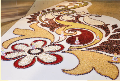
豆のブーカラム! 今年は高さ2.5mの象! 「かぼちゃ🎃」マークを探そう! 食べられる植物

9月9日(土)～11月5日(日)は「あわじグリーンフェスティバル2023」を開催!