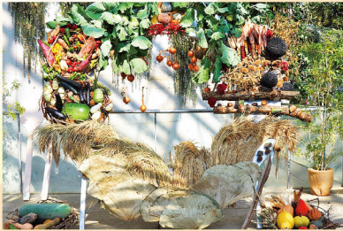
野菜気分で記念撮影!