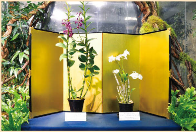
天皇后両陛下下のラン(10月中旬～)