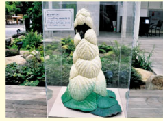
レウム・ノビレ(セイタカダイオウ)